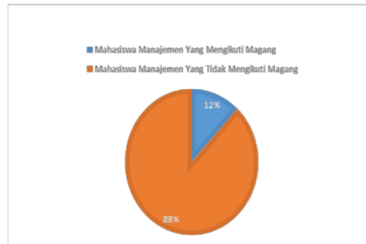
Gambar 1. Diagram Perbandingan Keikutsertaan Program Magang

Internship Experience sebagai modal dalam peningkatan kompetensi dan keahlian. Internship Experience di anggap penting dalam meningkatkan kesiapan kerja yang matang [4], apabila mahasiswa tidak memilikinya tentu saja mahasiswa berkemungkinan akan sulit mendapatkan motivasi atau semangat yang tinggi dalam dirinya untuk menghadapi dunia kerja nantinya. Dari fenomena yang terjadi berdasarkan hasil wawancara pada objek penelitian, peneliti menyimpulkan bahwa karena sebagian besar mahasiswa manajemen UMSIDA tidak memiliki antusiasme yang tinggi terhadap program magang dan memilih untuk tidak mengikuti program magang. Disamping itu, akan mengakibatkan mahasiswa tidak benar – benar mengetahui potensi yang ada dalam dirinya sebagai bekal kemampuan dan Soft Skill saat memasuki dunia kerja. Pernyataan ini didasarkan pada jumlah populasi sebanyak 428 mahasiswa manajemen, yang hanya memperoleh < 50 mahasiswa atau dengan persentase 12% yang lolos dalam mengikuti program magang. Sedangkan, sisa persentase sebesar 88% merupakan mahasiswa yang tidak mengikuti magang seperti gambar dibawah ini.